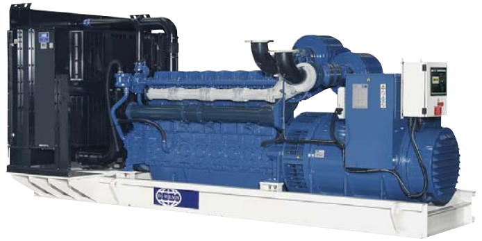
Рисунок приведен исключительно с иллюстративной целью