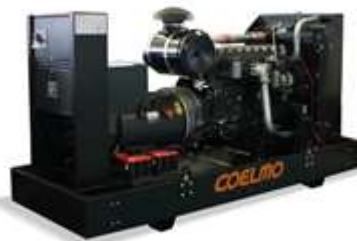
Safe Industrial / Innovative Future