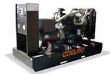
Safe Industrial / Inductive Future