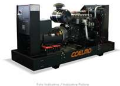
Safe Industrial / Industrial Future