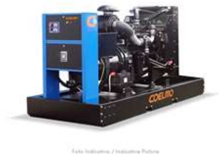
Safe Industries / Industrie Future