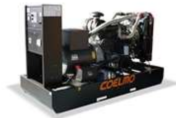
Safe Industrial / Innovative Future