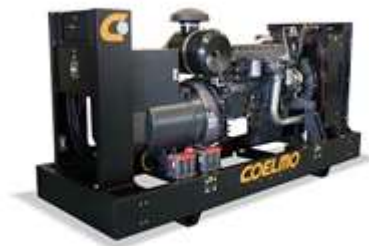
Safe Industrial / Industrial Future